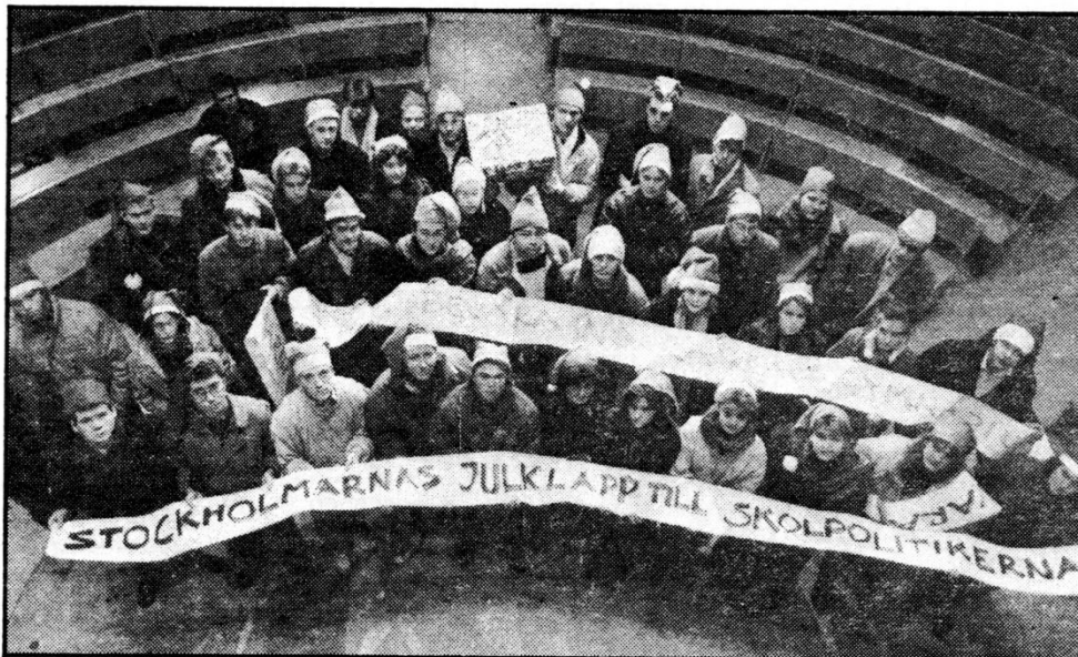
Norra Reals elever överlämnar i dag en nästan 730 meter lång lista med 72 945 namnunderskrifter mot nedläggningen av skolan till skolborgarrådet Margareta Schwartz.